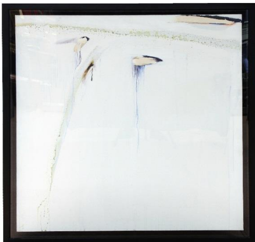
Tache blanche des hauts par Olivier Debré, en 1985 acquis directement auprès de l'artiste par le collectionneur. Est. 20/25.000 €