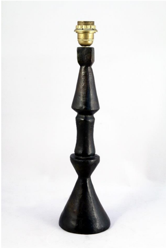
Lampe flambeau par Alberto Giacometti, en bronze vers 1934, provenant de la collection du peintre Francis Gruber Est. 30/50.000 €