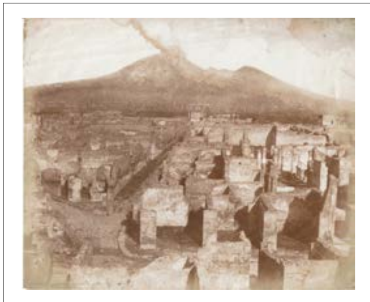
Naples. View of the town from South. 1846-1847 Épreuve sur papier salé d'après un négatif papier. Mention du titre à l'encre au dos. 17 x 20,8 cm.