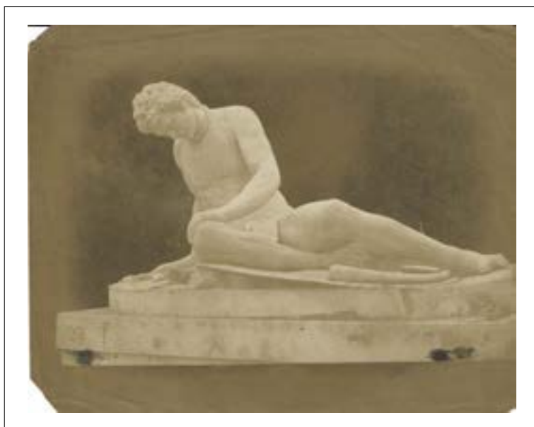
Rome, capitol. The dying gladiator. 1846. Épreuve sur papier salé d'après un négatif papier. Quatre angles coupés. 16,2 x 21,2 cm.