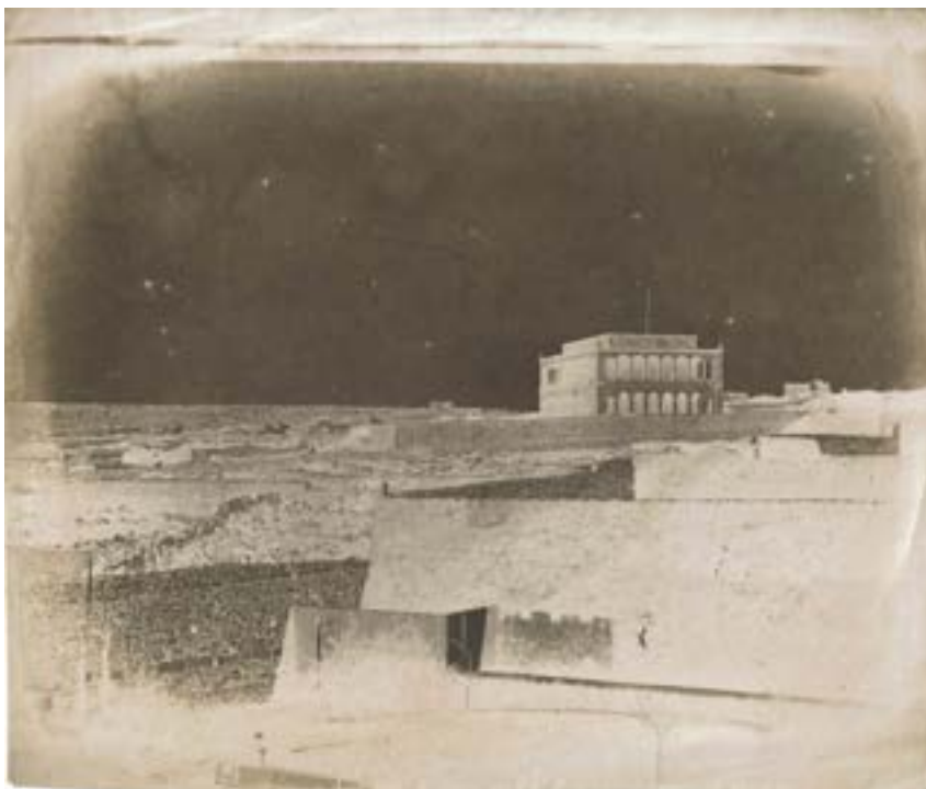
Fortifications of Malta. 1846. Négatif papier. 18,2 x 21,6 cm.