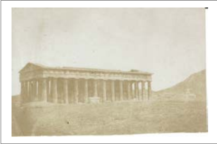
Temple of Concordia, Agrigento, Sicile. 1846-1847

Épreuve sur papier salé d'après un négatif papier. Filigrane (Watermark) «JOYSONS 1846». 18,5 x 20,6 cm.