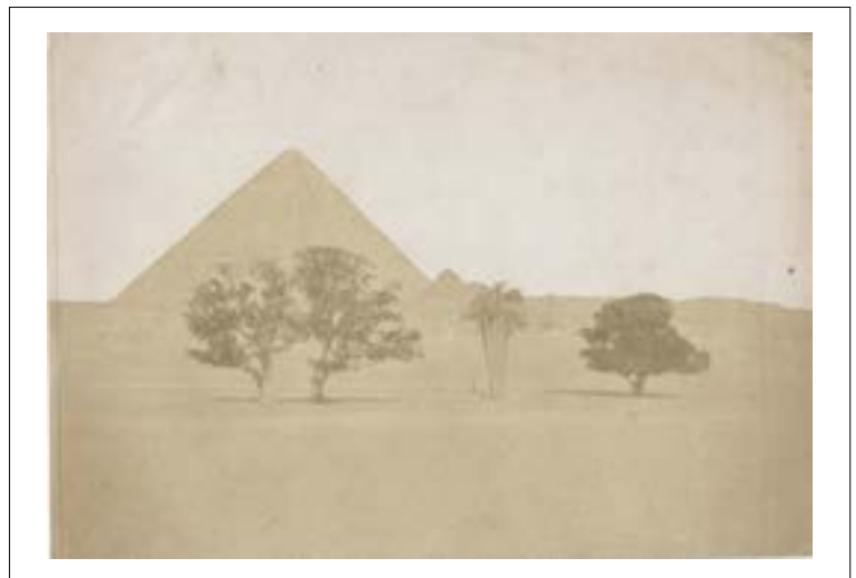
Pyramide de Khéops, Gizeh. 1851. Épreuve sur papier salé d'après un négatif papier. 14,7 x 21,4 cm. Une vue similaire et de même format a été réalisée par Maxime Ducamp en 1849.