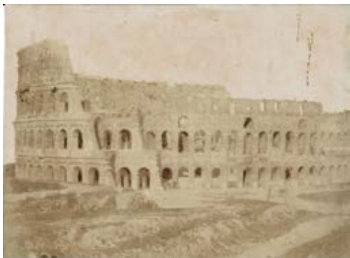
Rome: Coliseum. 1846. Épreuve sur papier salé d'après un négatif papier. 14,2 x 20,3 cm.