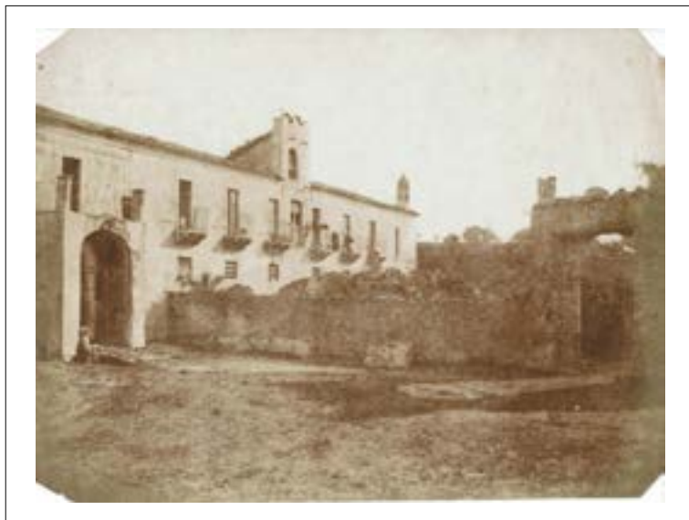
Convent of St Nicolo, Catania, Sicile. 1846. Épreuve sur papier salé d'après un négatif papier. Quatre angles coupés. Mention manuscrite (illisible) à la mine de plomb au dos. 16 x 21,3 cm.