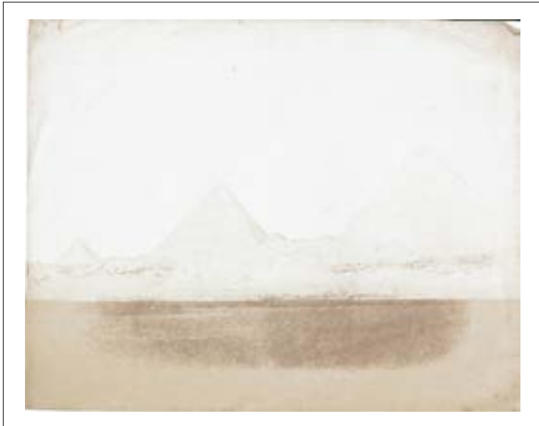
Pyramides de Gizeh. 1851. Épreuve sur papier salé d'après un négatif papier. 17,1 x 21,6 cm.