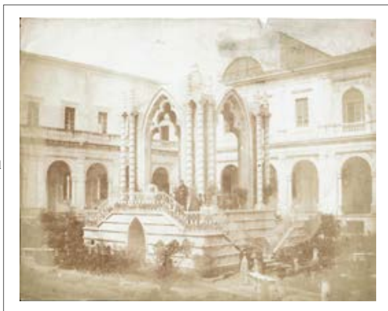
Garden of the Benedictine Monastery of San Nicolo l'Arena, Catania, Sicile. 1846. Épreuve sur papier salé d'après un négatif papier. 17 x 21,5 cm. Des variantes de cette vue sont conservées au National Media Museum de Bradford.