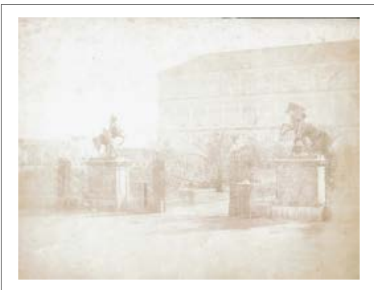
The king's palace. Naples, 1846-1847.

Épreuve papier salé d'après un négatif papier. Mention du titre à l'encre au dos. 14,3 x 21 cm.