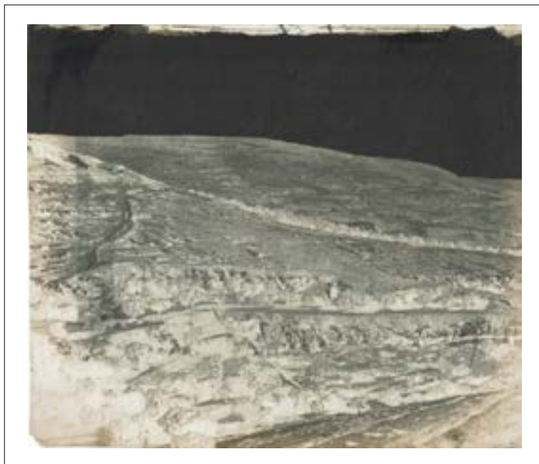
Akeldama "the potter's field", from the southern base of Mt Sion.

Akeldama & its rock tombs - from the foot of the "Mt. of Offence" above the Angel 19 th July - 3 - 3 P.M.