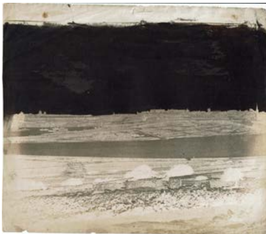
Malta, 24 juin 1846. Négatif papier. Nuages peints dans le ciel encré de noir. Mention manuscrite à l'encre au dos du négatif. 18,9 x 22 cm.