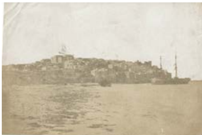
Ship in the port of Malta. 1851.

Épreuve sur papier salé d'après un négatif papier. 15 x 21,6 cm.