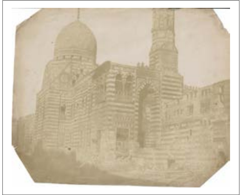
Al-Azhar mosque, Le Caire. 1851. Épreuve sur papier salé d'après un négatif papier. Quatre angles coupés. 18 x 22,2 cm.