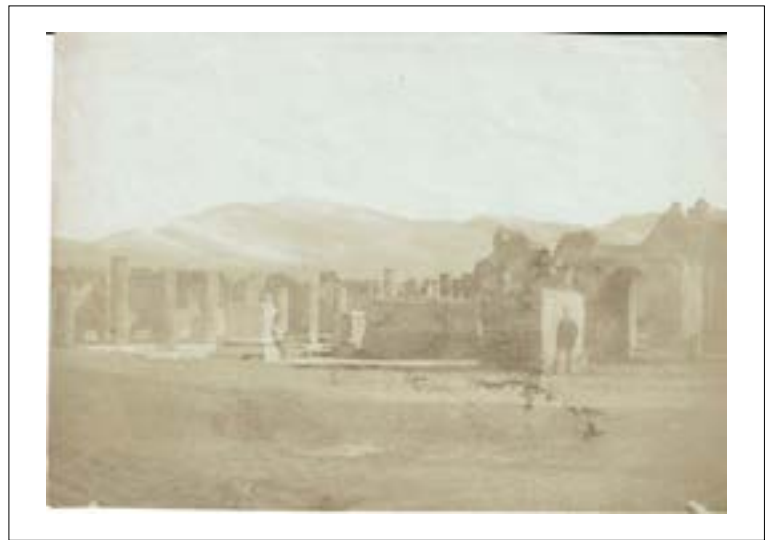
Forum of Pompeii. 1846-1847.

Épreuve sur papier salé d'après un négatif papier. Filigrane (Watermark) «JOYSONS 1846». 18,5 x 20,6 cm.