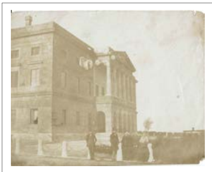
Quatre personnages en tenue de ville devant deux édifices. 1846-1852. Épreuve sur papier salé d'après un négatif papier. 16,8 x 21 cm.