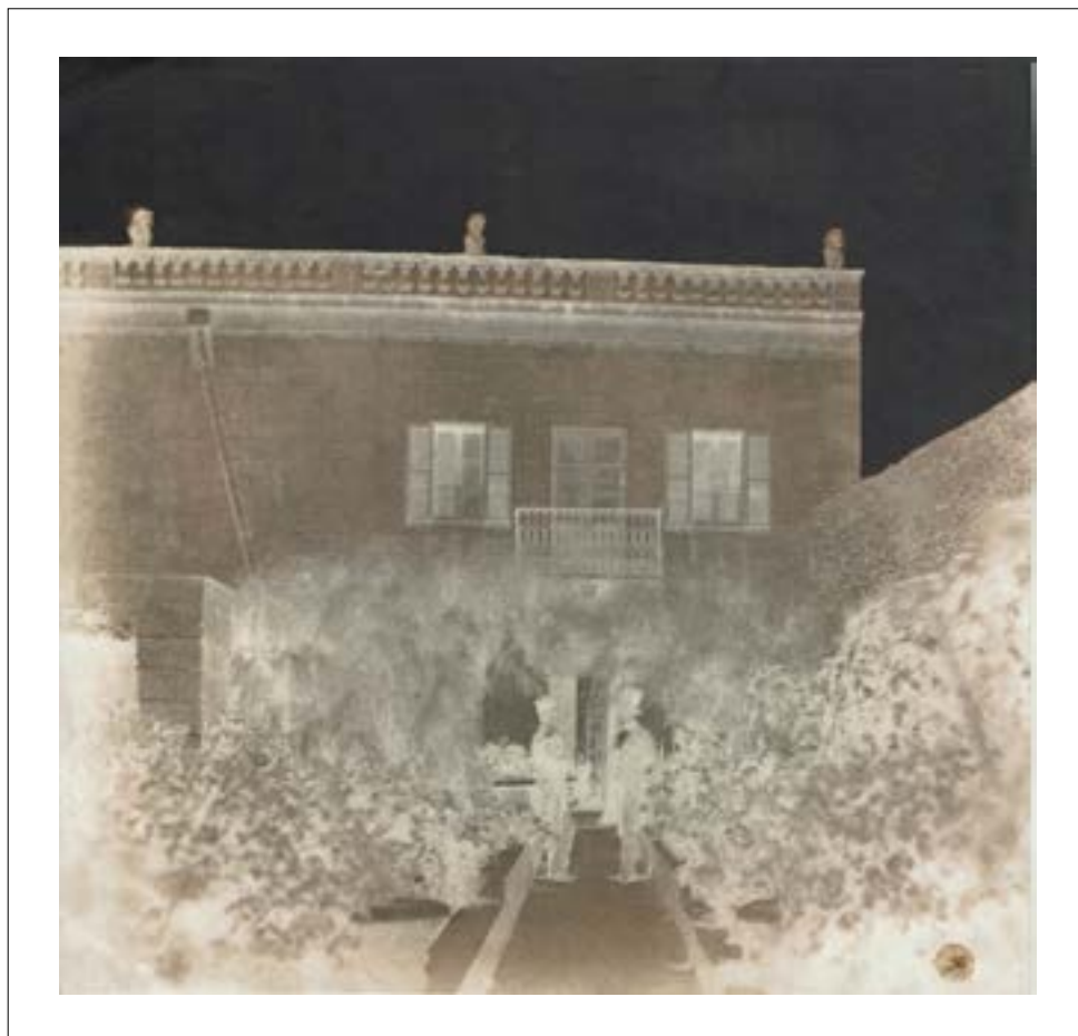
Front of my home at Sliema. May 1851.