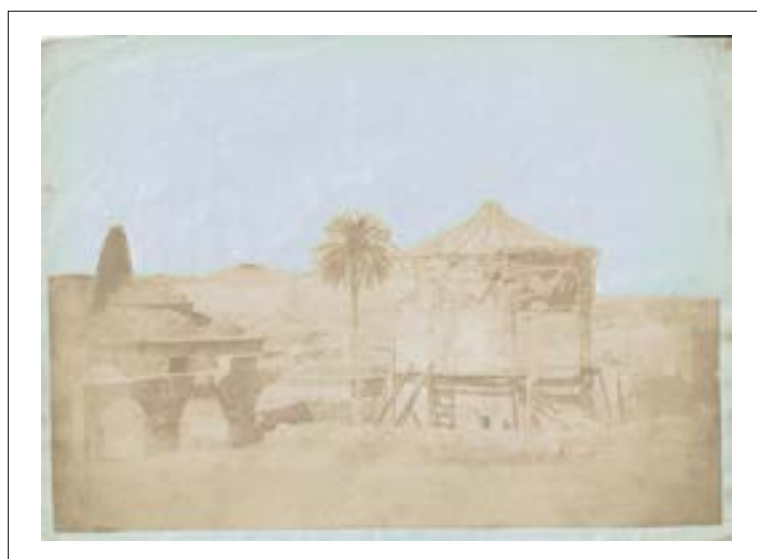
Athens, roman agora, the Fethiye mosque and the tower of the winds. 1848.

Épreuve sur papier salé d'après un négatif papier, découpée et collée sur papier bleuté. Format du montage : 16,3 x 22,2 cm.