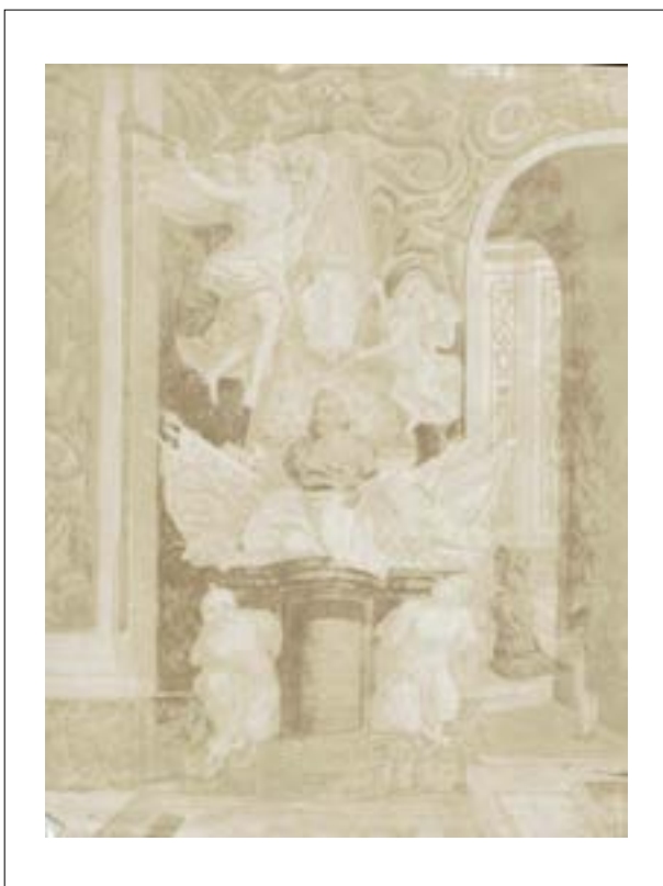
St John co-cathedral, gem of baroque art. Shrine to the knights of Malta, 1846.

Épreuve sur papier salé d'après un négatif papier.